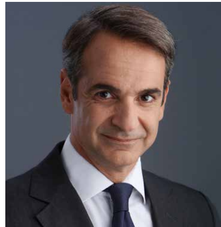
ΚΥΡΙΑΚΟΣ ΜΗΤΣΟΤΑΚΗΣ Πρωθυπουργός

Για πρώτη φορά στην ιστορία της, η Ελλάδα αποκτά, σήμερα, Εθνικό Σχέδιο για τη Δωρεά και Μεταμόσχευση Οργάνων. Έναν πραγματικό καταστατικό χάρτη για αυτήν την πρωτοπόρα κατάσταση της ιατρικής επιστήμης, που ήλθε ο καιρός να αναπτυχθεί και στη χώρα μας, υπηρετώντας τη ζωή και την υγεία των συμπολιτών μας.