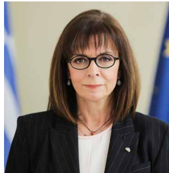
ΚΑΤΕΡΙΝΑ ΣΑΚΕΛΛΑΡΟΠΟΥΛΟΥ Πρόεδρος της Δημοκρατίας

Στον τομέα των μεταμοσχεύσεων η Ελλάδα, σύμφωνα με τα στοιχεία του Εθνικού Οργανισμού Μεταμοσχεύσεων, μειονεκτεί. Η ελλιπής ενημέρωση και ο φόβος για το ευαίσθητο αυτό θέμα, η υστέρηση σε επίπεδο υποδομών και οι χρόνιες παθολογίες του κρατικού ιστού λειτουργούν ανασταλτικά για την εθελοντική προσφορά οργάνων εκ μέρους του κοινωνικού συνόλου και τη διάδοση του ιατρικού αυτού επιτεύγματος στη χώρα μας.